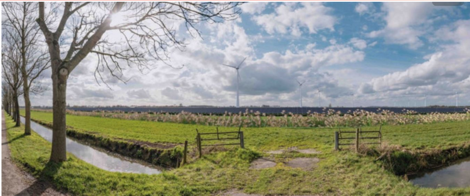
▲ Een impressie van hoe het 'energielandschap' in de polder Rijnenburg eruit kan komen te zien.